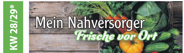
*KW 29: Pattonville und Oeffingen

Veröffentlichen Sie jetzt Ihre Anzeige auf unseren Sonderseiten um Ihr Unternehmen werbewirksam zu präsentieren.