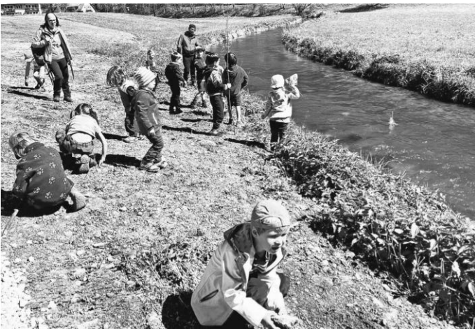
An der Lauter war es am Schönsten