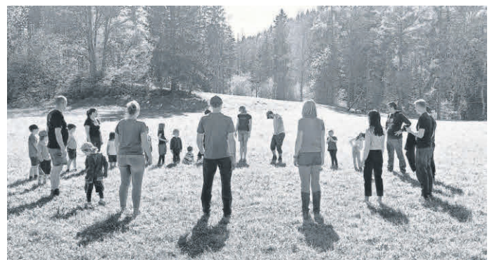
Faul Ei auf der Wiese

Vom 26. bis 28. April fuhren wir mit knapp 40 Erwachsenen und Kindern ins schöne Lautertal und haben dort bei bestem Wetter, gemeinsamer Wanderung, Lagerfeuer, Spielen, der ausgiebigen Erkundung sowie Besteigung der Burg und abendlichem Gitarrenspiel wunderschöne Tage verbracht, auf deren Wiederholung im nächsten Jahr sich schon alle wieder freuen!