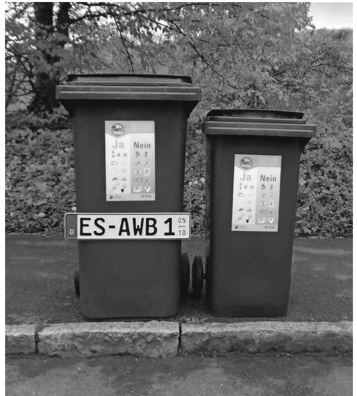
(Claire Hermann, Abfallwirtschaftsbetrieb)

Nähere Informationen zur Saisonbiotonne und zur Bestellung stehen im Müll-Kalender und auf der Homepage des Abfallwirtschaftsbetriebs unter www.awb-es.de aufgeführt oder können telefonisch erfragt werden unter Telefon 0800 9312-526.